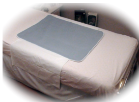
B – Coussinet régulier avec des ailes