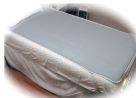
C – Coussinet plein matelas ancré avec 4 coins élastiques