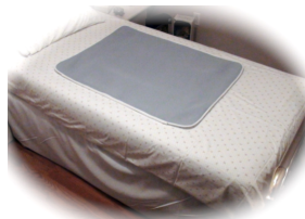
A – Coussinet régulier