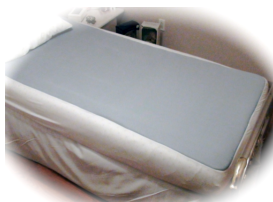
D – Coussinet plein matelas contour